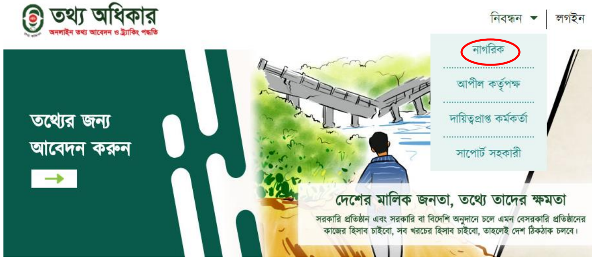
চিত্র: ১ (নাগরিকের নিবন্ধন)

তৃতীয় ধাপঃ ওয়েবসাইটের 'নিবন্ধন' বাটনে ক্লিক করলে আপনি ড্রপ-ডাউনে চারটি অপশন দেখতে পারবেন (চিত্র: ১)। অপশনগুলোর মধ্য থেকে 'নাগরিক' এর উপর ক্লিক করলে নাগরিকের নিবন্ধনের পৃষ্ঠাটি দেখতে পারবেন।